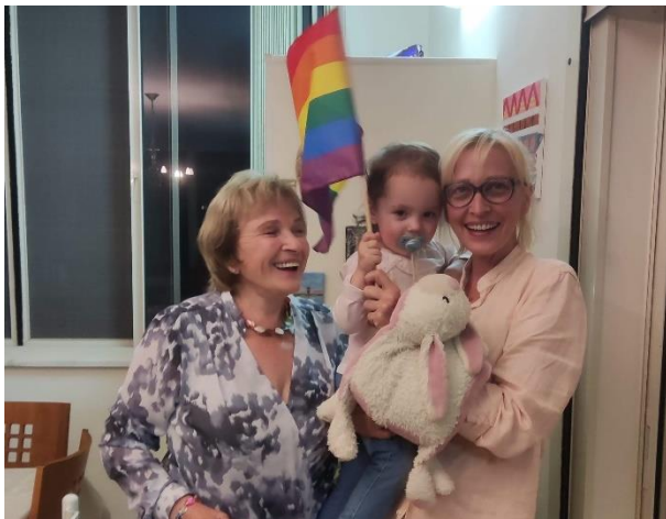
התינוקת התאהבה בדגל הגאווה